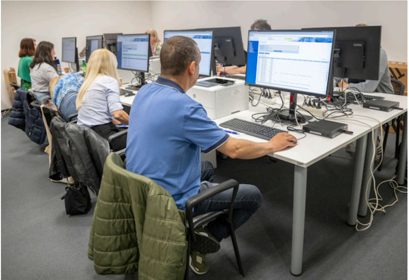
Obrázok: Tretia skúška spracovania výsledkov volieb do Európskeho parlamentu 2024 v Odbornom sumarizačnom útvere ŠÚ SR v Bratislave.